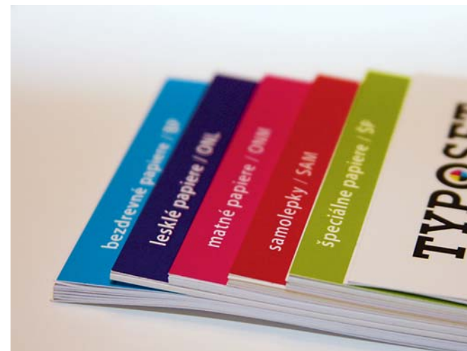
Nový potlačený vzorkovník papierov pre digitálnu tlač spoločnosti TYPOSET obsahuje viac ako 80 papierov a plastov.