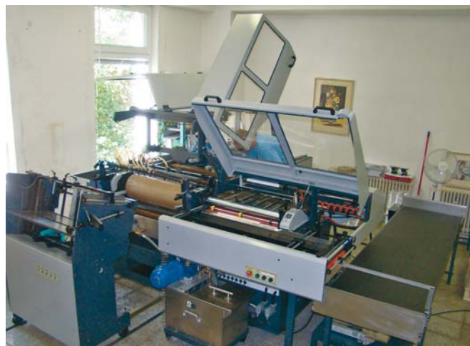
Zariadenie na výrobu knižných dosiek (väzba v8)

Ktorý z titulov vydavateľstva VEDA vydavateľstva SAV pokladáte za zaujímavý?