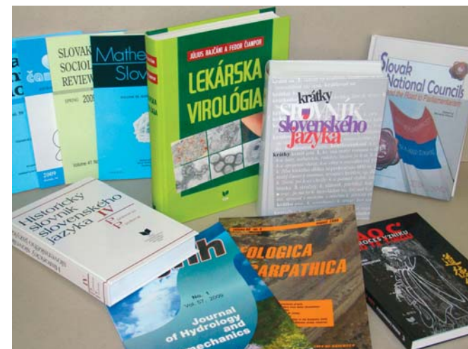
Zariadenie na výrobu knižných dosiek (väzba v8)

(I. zv. A – G), ale aj ďalšími edícnymi činmi. Pozornosť by som rád upriamil na už spomínanú populárno-vedeckú edíciu Svet vedy, v ktorej doteraz vyšla desiatka titulov z oblasti geológie, astronómie, chémie, ekológie, kardiochirurgie a ďalších odvetví. Vlni sme ukončili vydávanie iného zaujímavého projektu – sedemzväzkového Historického slovníka slovenského jazyka, ktorý mapuje lexikálne bohatstvo slovenčiny v predbernolákovskom období – teda do konca 18. storočia. Prínos znamenajú aj rozsiahle diela z medicíny – Gastroenterológia, Onkológia, Lekárska virológia, Imunológia